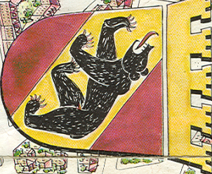
Voorbeeld uit Vrijeschool De Zevenster te Uden

Aussichtspunkt: point de vue; blyveder; view point